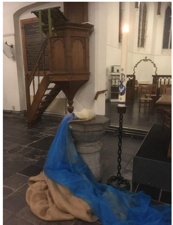
Uitzendviering "de Jabbok".